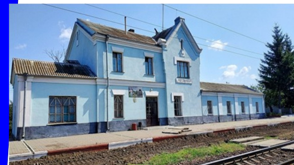
Залізнична станція у селищі Богданівці

Хмельницька міська рада Управління культури і туризму Централізована бібліотечна система Хмельницької міської територіальної громади Центральна публічна бібліотека