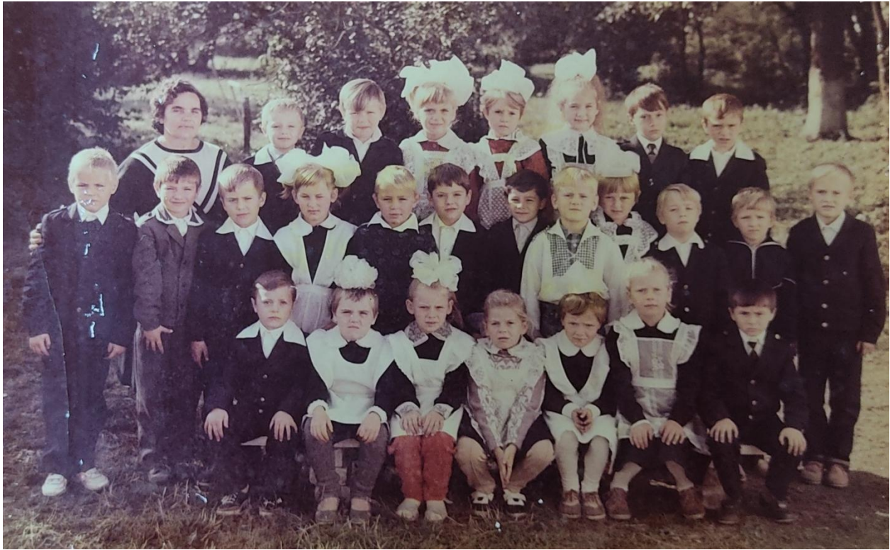
с. Копистин. Початкова школа