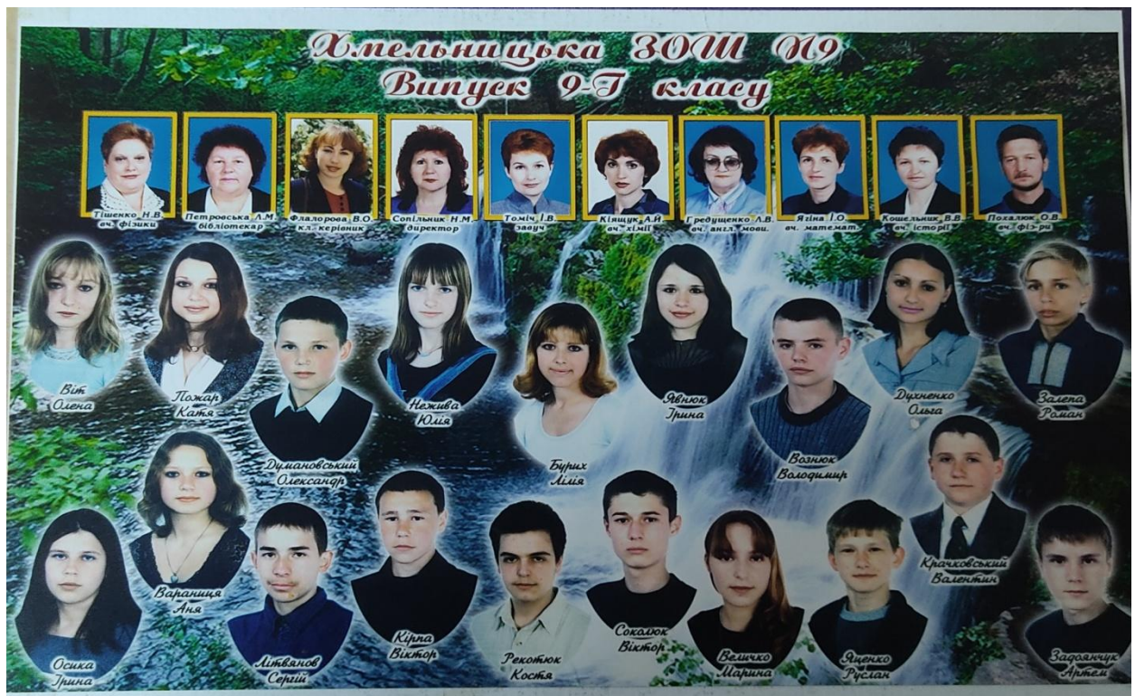
м. Хмельницький, ЗОШ № 9, 9 клас