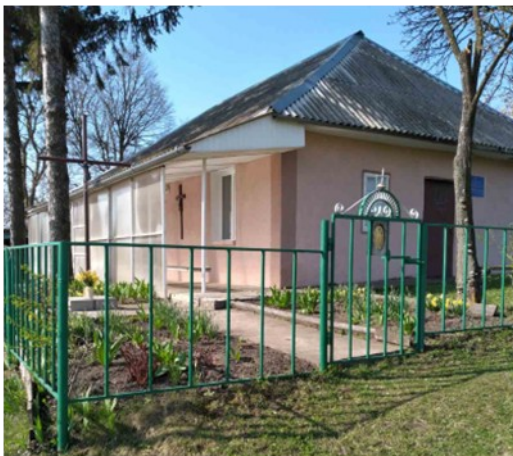
Каплиця Пресвятої Діви Марії Летичівської

А у 2011 році розпочалася реконструкція колишньої колгоспної будівлі в костел Матері Божої Летичівської.