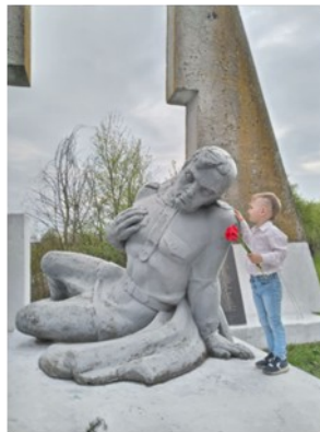
Пам'ятник загиблим у Другій світовій війні

Під час Другої світової війни загинуло 67 осіб. Майже чотири роки село перебувало в неволі. В березні 1944 р. село було звільнене від німецьких окупантів.