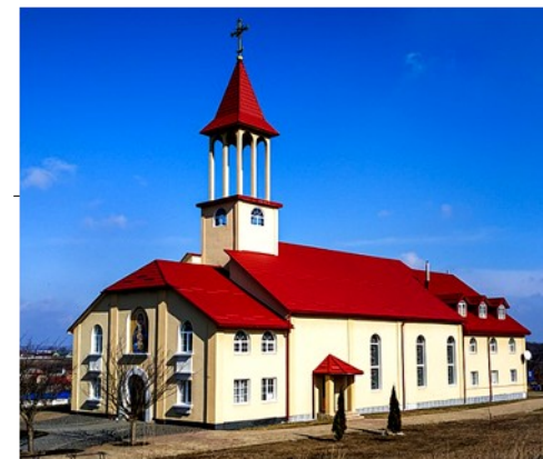
Костел Матері Божої Святого Розарію

Хмельницька міська рада Управління культури і туризму Централізована бібліотечна система Хмельницької міської територіальної громади Центральна публічна бібліотека